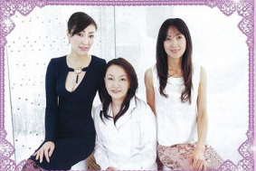
手に通ってチェック、しっとりと唇や顔の導きを受ける!

片桐先生自身が肌のコンプレックスを克服した経験を活かして開発したコスメは、徹底した保湿によってパリア機能強化する効果的でシンプルなおインナー!